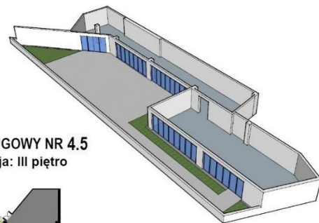
LOKAL USŁUGOWY NR 4.5 Lokalizacja: III piętro