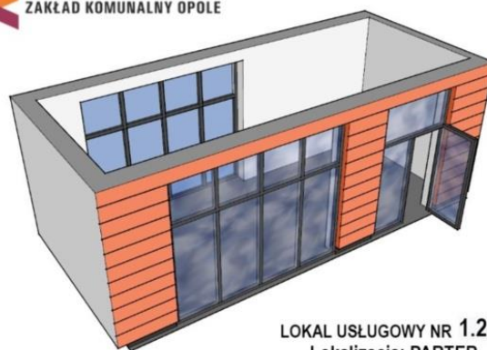
LOKAL USŁUGOWY NR 1.24 Lokalizacja: PARTER