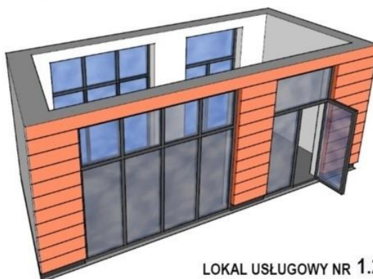
LOKAL USŁUGOWY NR 1.29 Lokalizacja: PARTER