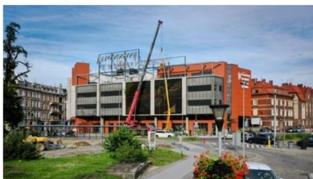
CENTRUM PRZESIADKOWE OPOLE GŁÓWNE

Rokowania odbędą się w dniu 16 października 2023 roku od godziny 10 00 w budynku Centrum Przesiadkowego przy ul. 1 Maja 4 w Opolu.